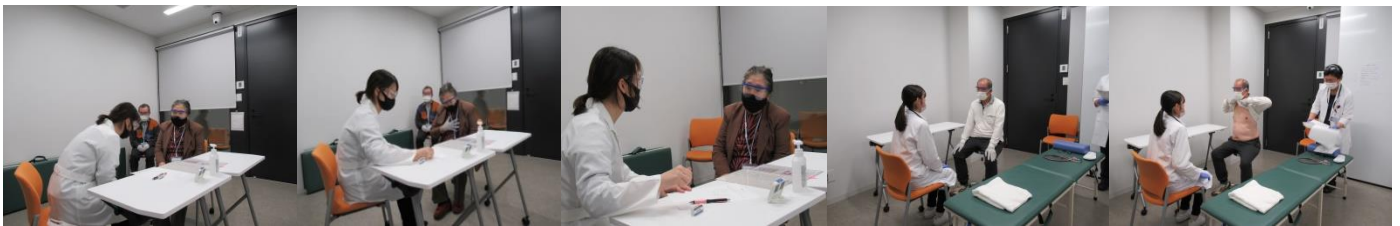
導入後学生の自己紹介と患者氏名と生年月日の確認。本日の症状聞く。