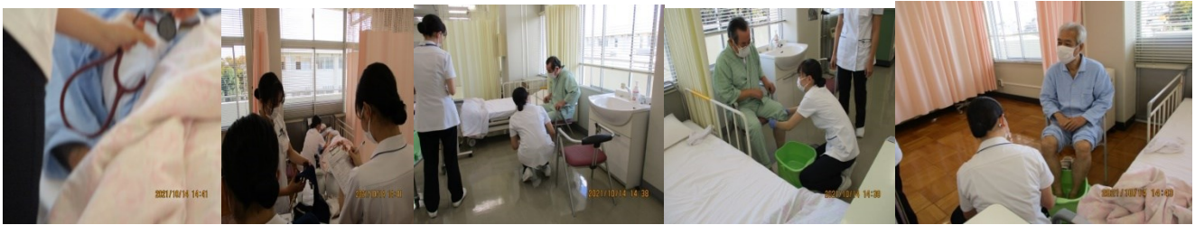
手術後の傷の点検 足浴の支度と濡れないように気配りする学生 気持ちがいいと SP

○10月21日(木)・22日(金) 昭和大学医学部の高齢者コミュニケーション演習を10名のSPで12:30から行いました。シナリオは例年通りです。