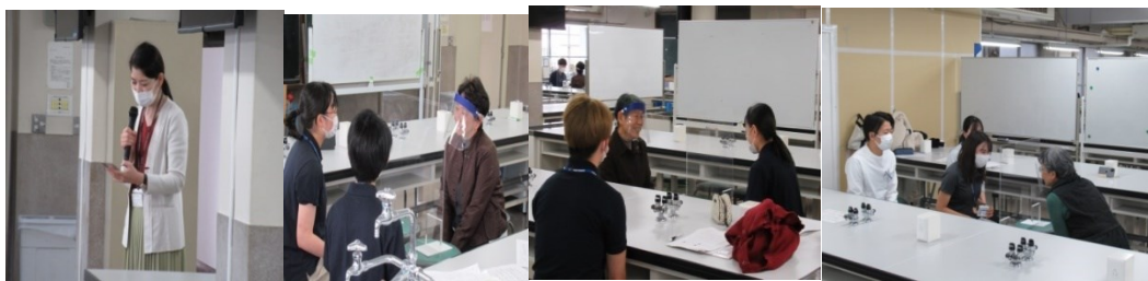
教官からの説明を受け3名一組で広い実験台の教室で面接をしました、女性性 SP の八百屋のおばさん

○10月21日(木)・22日(金) 昭和大学医学部の高齢者コミュニケーション演習を10名のSPで12:30から行いました。シナリオは例年通りです。