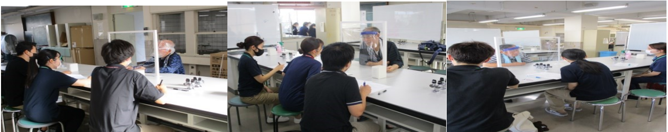
大工の仕事を説明する SP なんで手拭つけてるのとの質問に身をのりだして説明する SP 聞き入る学生