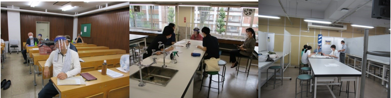
全員集合で、田中先生から注意点を聴く SPは女性と男性に分かれての面接。元大工さんのお宅と元八百屋のおばさん宅に訪問

○10月4日(月)12:30-16:00 昭和大学歯学部・保健医療学部理学療法学科・作業療法学科の学生に14名のSPが医療面接をしました。