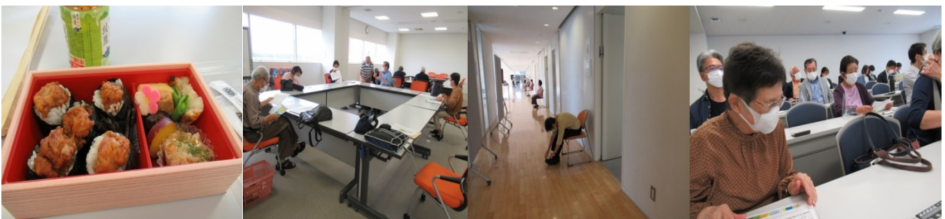
学校からのおいしいお弁当 シナリオの確認をする SP 広い教育棟で呼び込みを待つ SP OSCE 終了後の反省会。