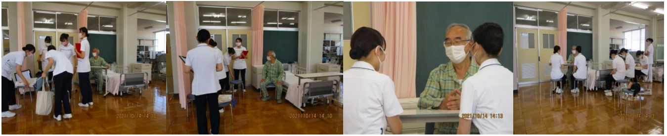
足浴用のお湯の確保と任務分担の確認 本日の作業目的と患者情報の確認と意見交換

○10月14日(木)9:00 から相模原看護専門学校に男性 SP8 名で医療面接をしました。