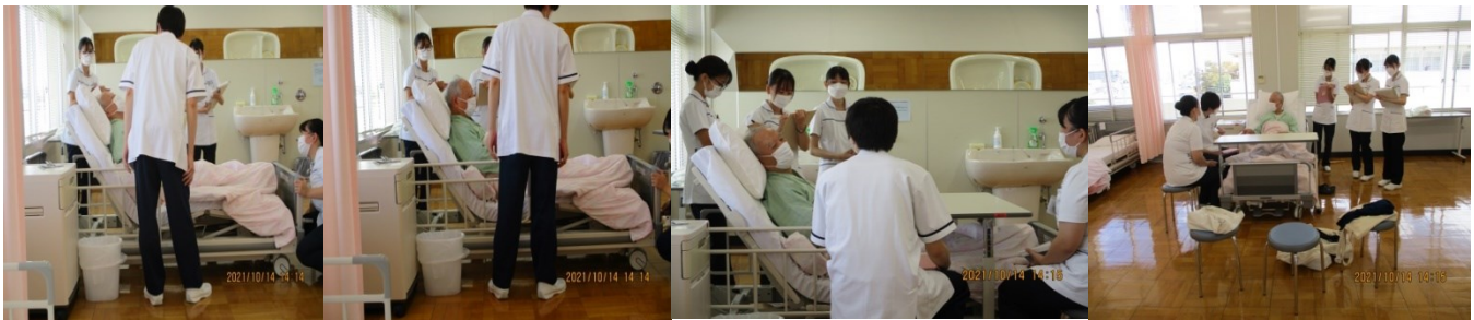
本日の作業の説明と問診ではなく、医療面接をする学生 対応する SP フィードバックにメモを取る学生